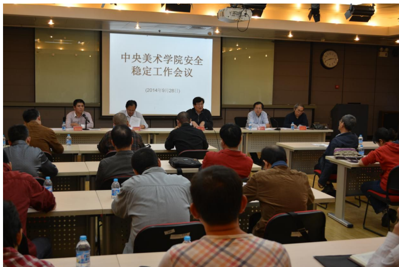
▲9月28日，学院安全稳定工作会强调控烟工作