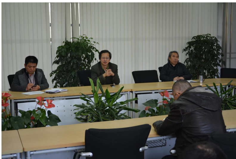
▲10月27日，学院控烟工作会进一步安排控烟和迎检工作