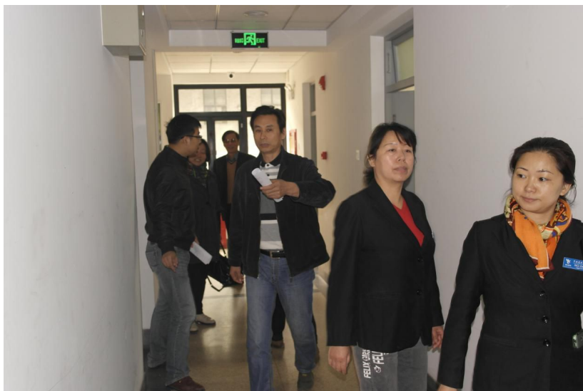
▲在学生公寓实地查看