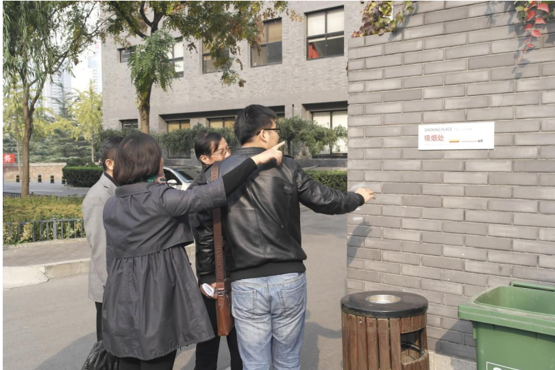
▲实地查看吸烟处设置情况