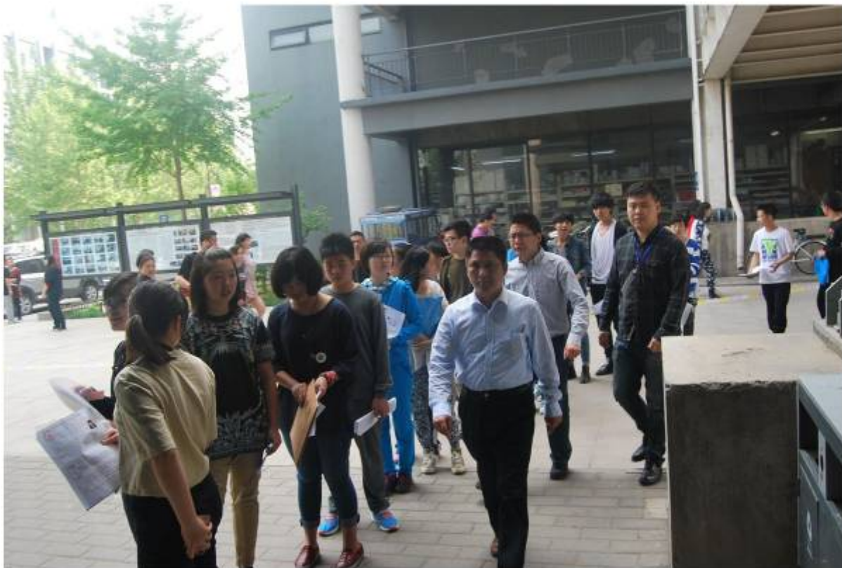
▮ 保卫处领导在报名现场巡查