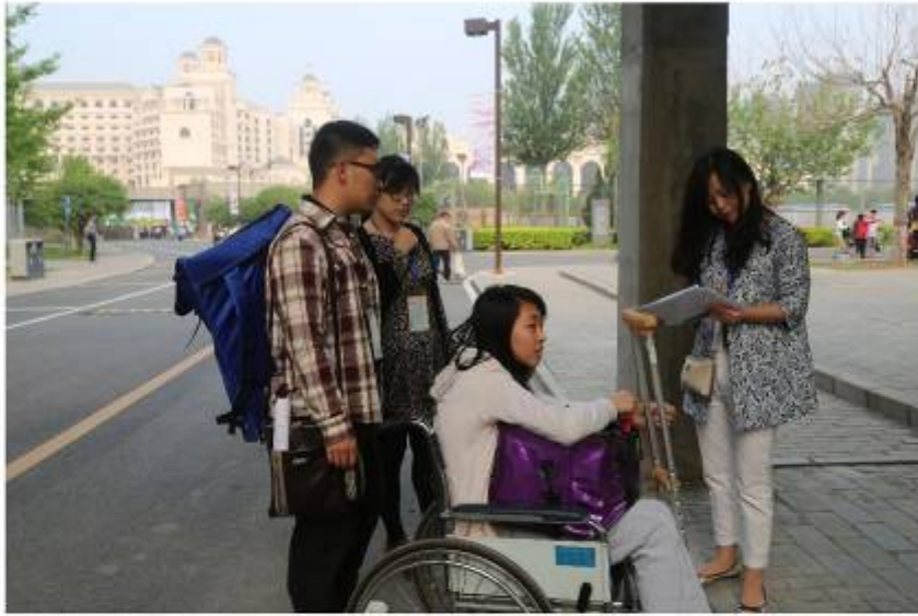
▮ 附中领导为考生提供咨询