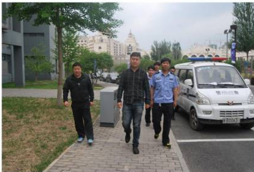
▮ 属地公安民警和警车配合保卫干部在考场外巡逻