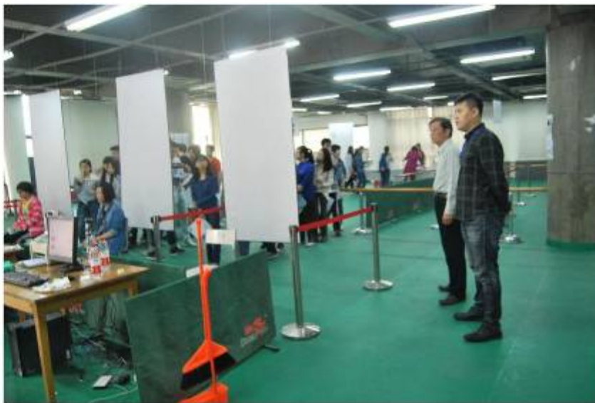
▮ 保卫干部在报名现场执勤