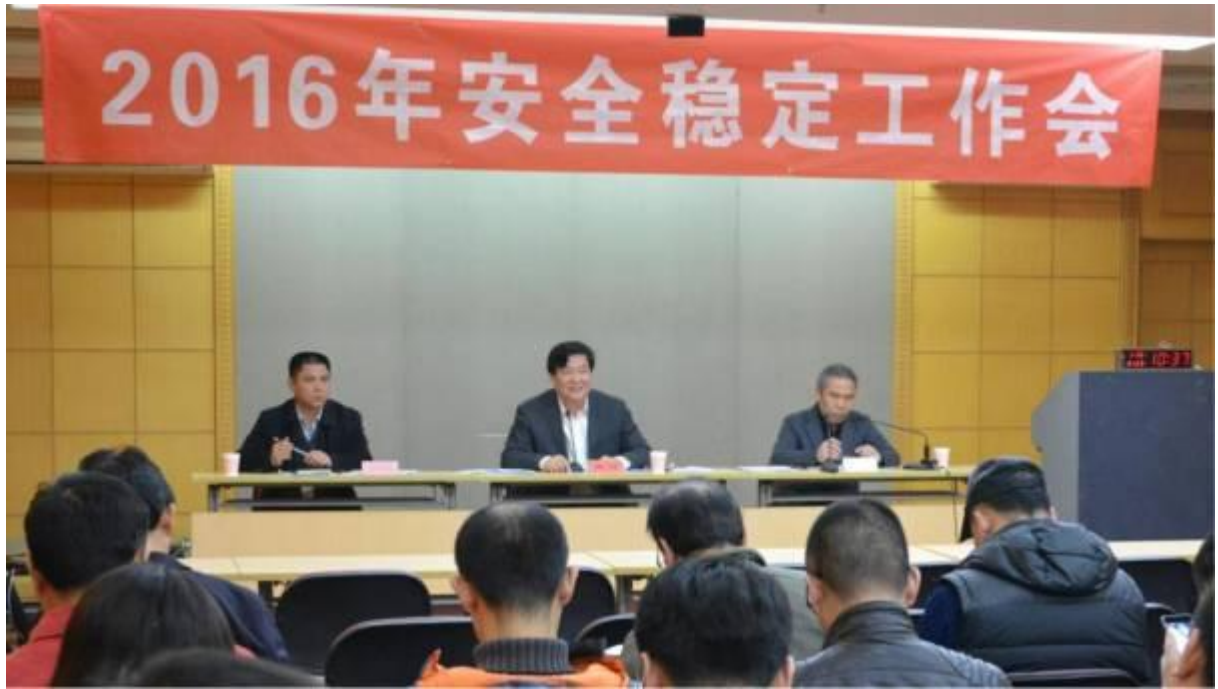
高洪书记对校园安全稳定工作作出指示