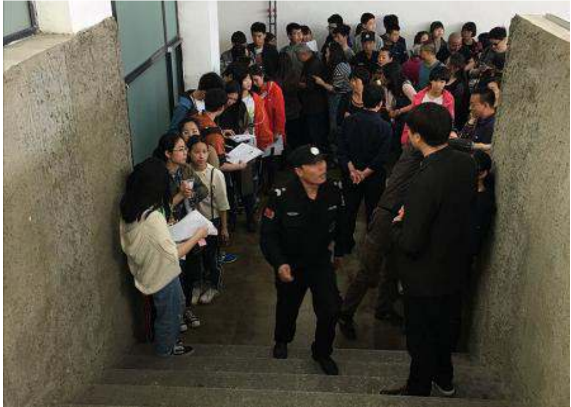
安保人员维护现场秩序