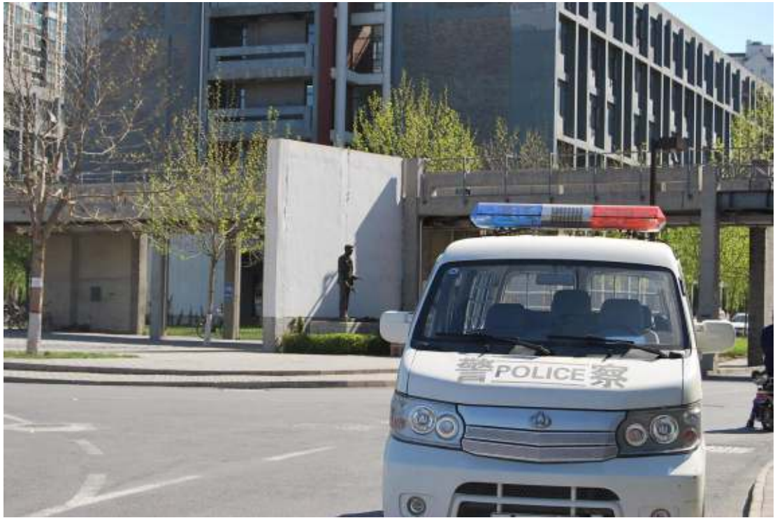
燕郊镇西城派出所向我校派驻警力维护考场秩序