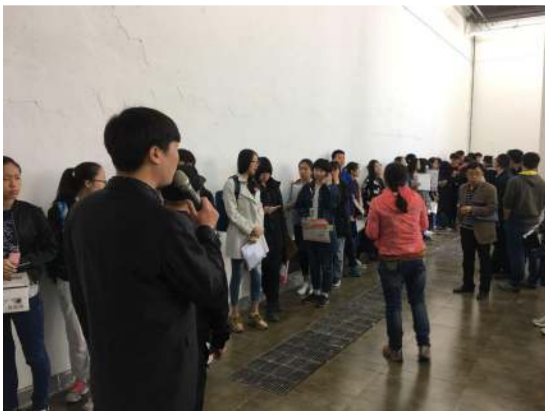
考生按号码牌顺序排队