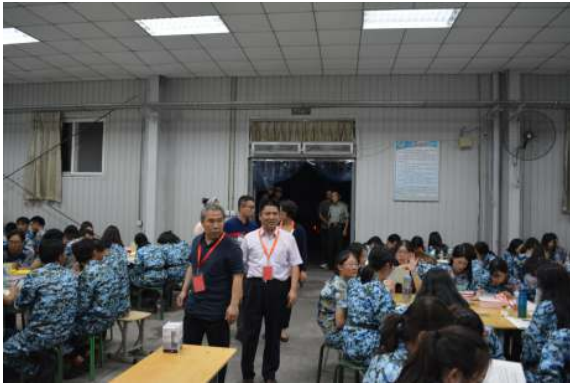
校领导带队巡视考场