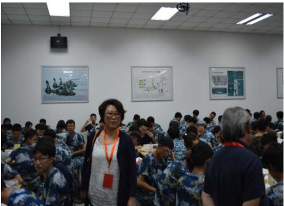
教务处领导巡视考场