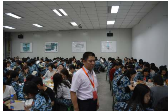
保卫处领导巡视考场